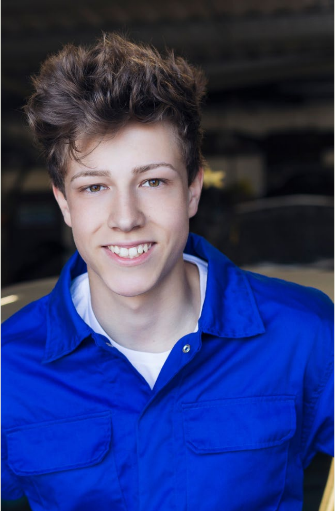
F.F., 17 Jahre, Lernender Automobilfachmann